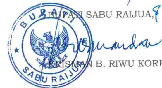
KRISMAN B. RIWU KORE