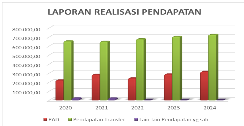
Grafik 5.1: Perkembangan Realisasi Pendapatan TA 2020-2024

Pendapatan Daerah Tahun 2024 terealisasi Rp1.038.143.488.453,00 atau mencapai 101,59 persen dari target dalam APBD Rp1.021.905.073.561,00. Realisasi Pendapatan Daerah Tahun 2024 mengalami kenaikan Rp50.867.189.955,00 atau 5,15 persen jika dibandingkan dengan Tahun 2023 yang mencapai Rp987.276.298.498,00. Realisasi Pendapatan Daerah Tahun 2024 berasal dari Pendapatan Asli Daerah sebesar Rp313.963.681.492,00, Pendapatan Transfer sebesar Rp724.166.549.022,00, dan Lain-lain Pendapatan Yang Sah sebesar Rp13.257.939,00. Realisasi Pendapatan Daerah sejak TA 2020 sampai dengan Tahun 2024 terlihat pada Grafik 5.1.