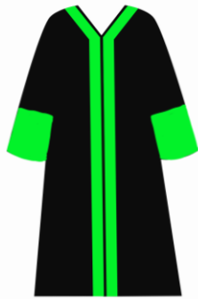
Toga jabatan Dekan Fakultas Tarbiyah dan Ilmu Keguruan