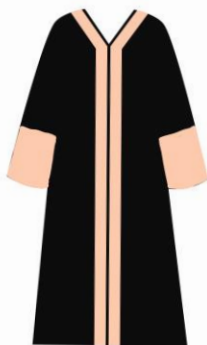
Toga jabatan Dekan Fakultas Ekonomi dan Bisnis Islam