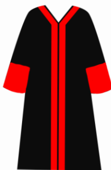
Toga jabatan Direktur Pascasarjana