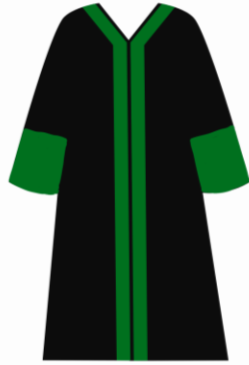
Toga jabatan Rektor dan Wakil Rektor