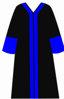
Toga jabatan Dekan Fakultas Ushuluddin, Adab, dan Dakwah